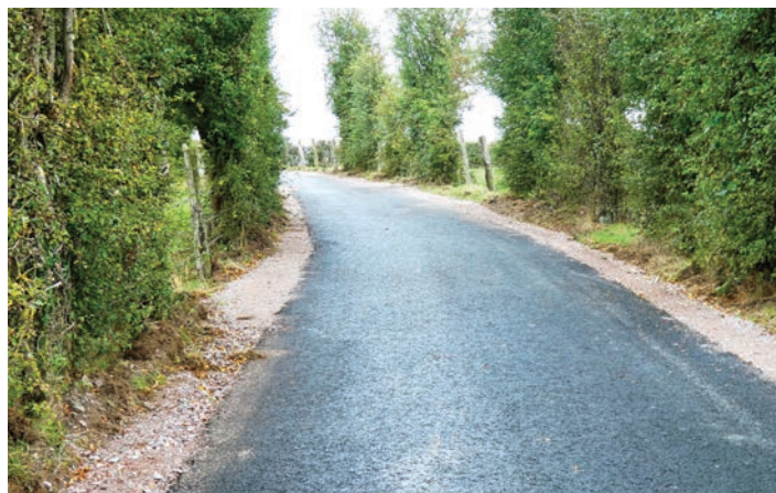
Chemin entre Fontenay-le-Pesnel et Tilly-sur-Seulles avant travaux à gauche et après à droite