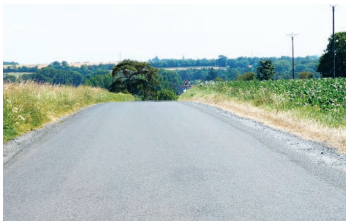
Villiers-le-Sec (Creully-sur-Seulles) - Route de Saint-Gabriel