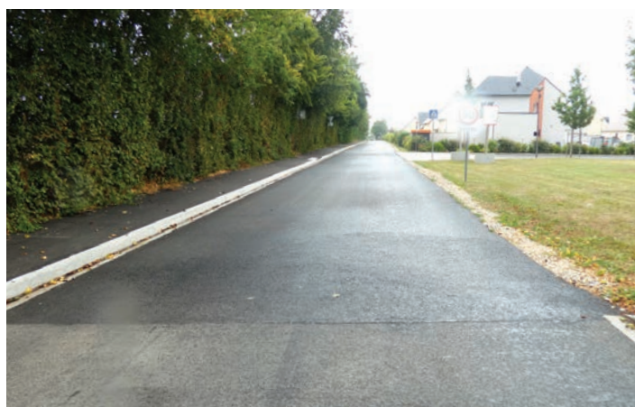
Lantheuil (Ponts-sur-Seulles) - Chemin blanc