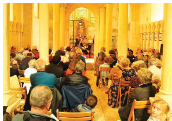
Concert au Château de Fontaine-Henry -13 août 2019

Mercredi : 10h-12h / 14h-18h - Samedi : 10h-12h