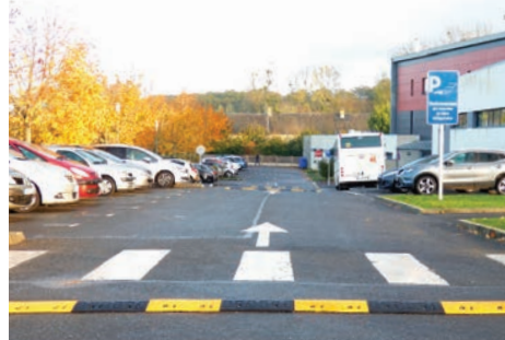
Sécurisation du parking de l'école d'Audrieu

À l'école d'Audrieu, la sécurisation du parking a été réalisée par la mise en place de ralentisseurs et de marquage pour un stationnement en marche arrière des véhicules.