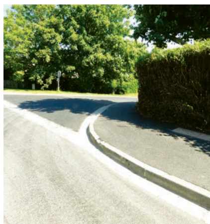
Tierceville (Ponts-sur-Seulles) Impasse Saint-Vital