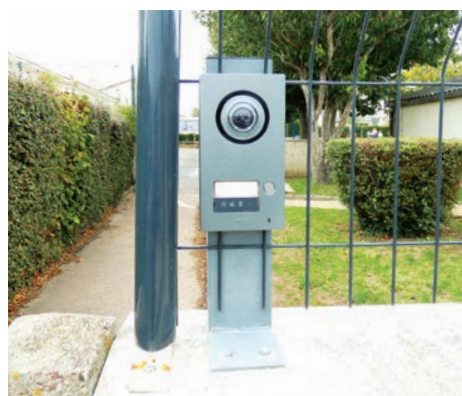
Installation de visiophones

Comme dans les autres écoles de STM , un visiophone a été installé à l'entrée du bâtiment. Ces visiophones permettent d'identifier et de contrôler l'accès des personnes dans l'enceinte des écoles. Ces installations ont été préconisées dans le cadre du PPMS (Plan Particulier de Mise en Sureté).