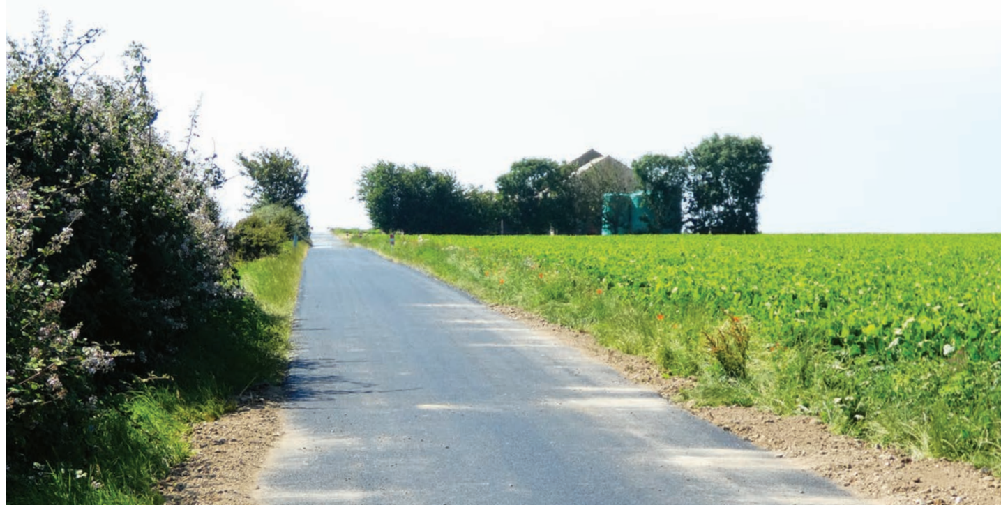
Banville - Route du Calvaire