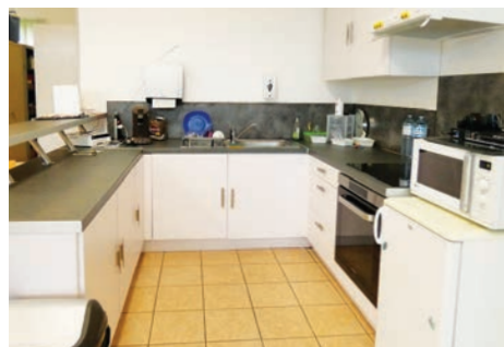
Peinture fraîche et nouvelle cuisine pour le local jeunes de Creully (Creully-sur-Seulles)

Le local jeunes de Creully (Creully-sur-Seulles) s'est refait une beauté. Afin de moderniser les lieux et apporter plus de luminosité, les équipes techniques de STM ont repeint les murs. De plus, et pour un meilleur confort, une cuisine neuve et entièrement équipée a également été posée. Pendant les périodes de vacances scolaires, les jeunes peuvent donc confectionner eux-mêmes leurs repas et leurs goûters, pour le plus grand plaisir de leurs animateurs. À vos assiettes !