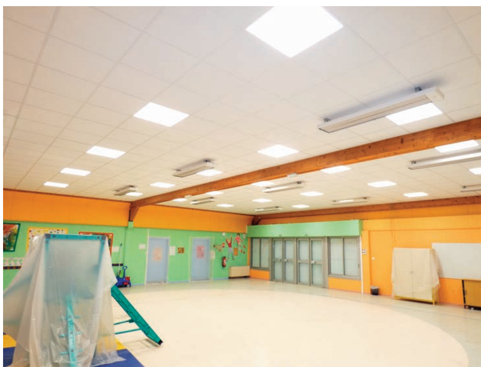
Installation de faux plafonds dans le hall de l'école de Creully (creully-sur-Seulles) pendant travaux à gauche et après à droite

L'entreprise Martragny TP a ainsi démonté la clôture existante pour la repositionner en retrait. Ce recul facilite le stationnement pour les transports scolaires. Les travaux auront duré près de trois semaines.