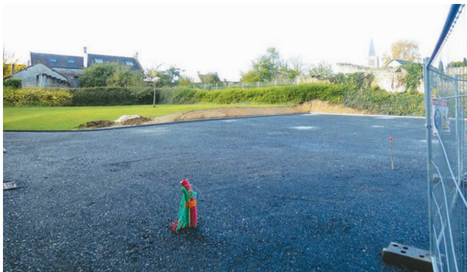
Agrandissement et sécurisation de la cour de l'école de Banville

À l'école de Banville , la cour a été agrandie pour un meilleur confort des enfants et un préau sera installé aux vacances de Noël. De plus, cette nouvelle cour permettra un usage plus sécuritaire pour l'entrée et la sortie des enfants.