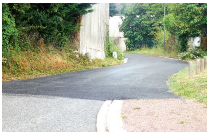
Rucqueville (Moulins-en-Bessin) - Allée du moulin aivent