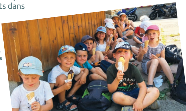
L'été des tout-petits à Tilly-sur-Seulles

L'été prochain, des travaux de changement des sols souples seront entrepris à l'école de Creully (Creully-sur-Seulles). Aussi, le centre de loisirs déménagera dans les locaux de l'école de Lantheuil (Ponts-sur-Seulles).