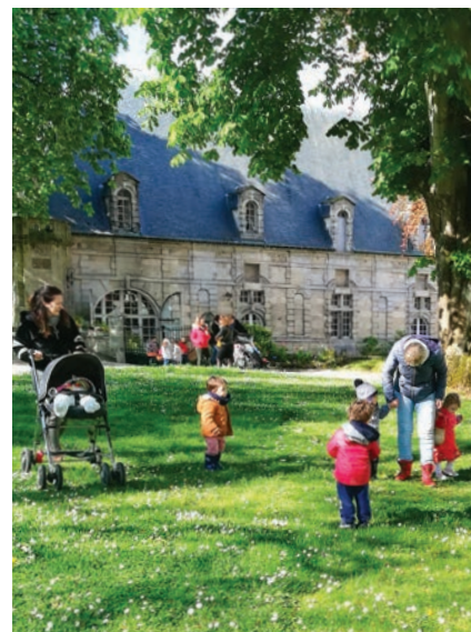
Atelier RAM - Pâques 2019

Vous pouvez retrouver le programme complet sur le site internet de STM