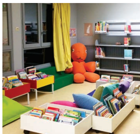
Un espace pour les tout-petits

Installée au premier étage d'un bâtiment sans ascenseur, l'ancienne bibliothèque était difficilement accessible. STM , dans le cadre de sa compétence culture, a décidé d'installer la nouvelle bibliothèque dans les locaux de l'ancienne école maternelle. Le lieu est dorénavant de plain-pied, plus grand (90m 2 ), rénové et réaménagé pour un budget de 15 000 €.