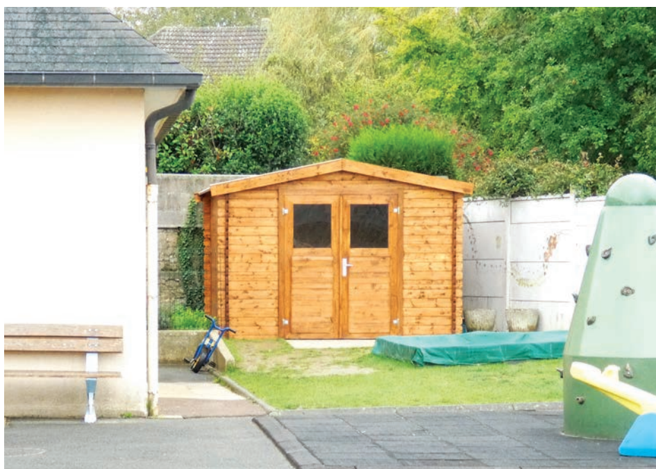
Cabanon pour le rangement du matériel pédagogique à Fontenay-le-Pesnel