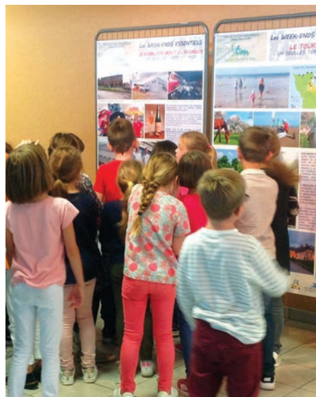
Vendredi après-midi avec les scolaires

L'exposition itinérante s'est déplacée de commune en commune du vendredi au samedi pendant deux mois, rythmée par des animations culturelles. Sur les panneaux étaient présentés les compétences et les missions de STM, les atouts du territoire.