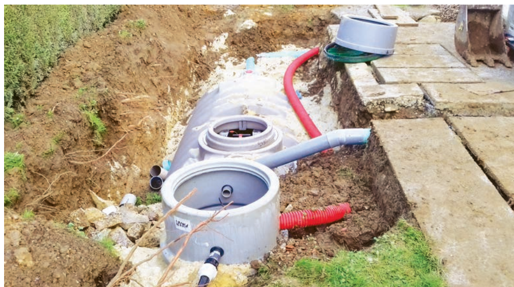
Enfouissement d'une micro station