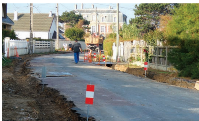
Asnelles - Rue Xavier d'Anselme pendant les travaux