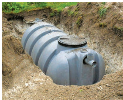
Diagnostic d'une micro station

Retrouvez tous les formulaires sur le site internet de STM.