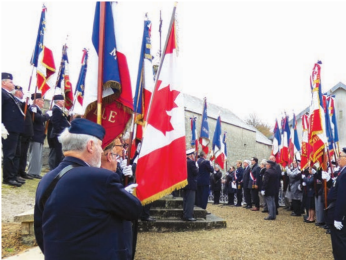
53 porte-drapeaux présents

Une cérémonie commémorative a été organisée par STM samedi 10 novembre 2018 à Martragny (Moulins-en-Bessin) quasi centre géographique de l'intercom.