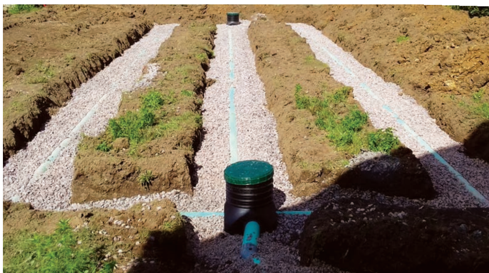
Installation d'un lit d'épandage