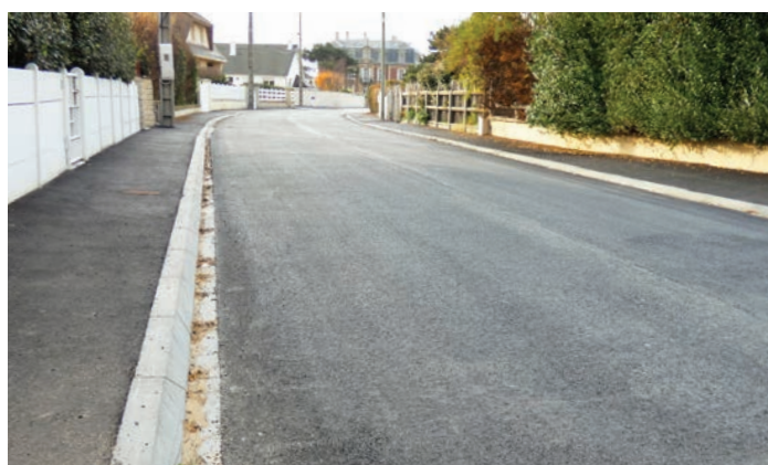
Asnelles - Rue Xavier d'Anselme après travaux