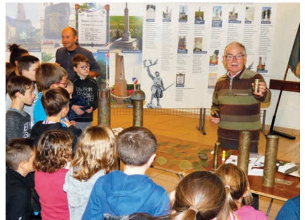
Atelier avec les scolaires

chée. Ces feuilles, dont certaines ont plus de 100 ans, étaient réalisées sur le front par les soldats, pour être envoyées à leur famille. On y trouvait souvent un mot doux, un prénom féminin, une date. Dans du papier, du zinc, de l'aluminium, les soldats découpaient l'empreinte du motif où du texte à faire apparaître sur la feuille, puis la collait. Un tissu épais était posé pour obtenir un transfert et la dernière étape consistait à enlever délicatement l'empreinte et nettoyer la feuille.