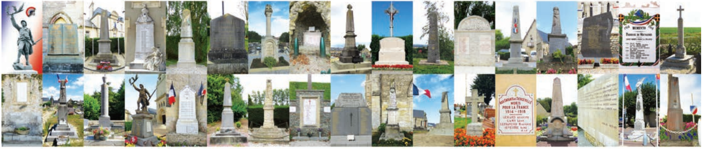
Le mur d'images