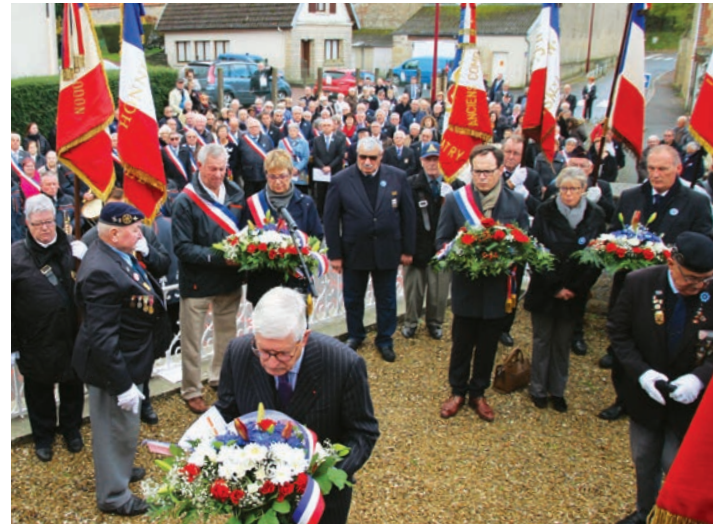
Dépôt de gerbes