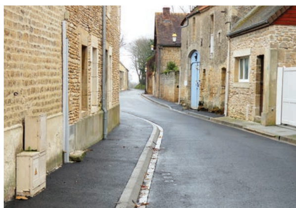
Bény-sur-Mer - Rue d'Asnières