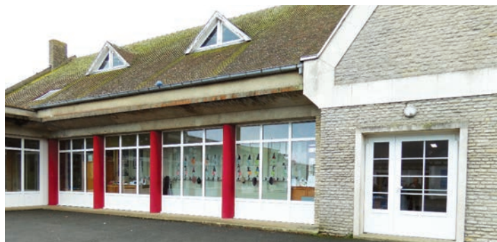
Changement d'huisseries - École de Ver-sur-Mer

primordiale, STM a décidé de réaliser ces travaux dès 2018 pour un montant de 27 709 €.