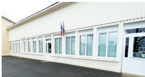
Changement d'huisseries - École de Fontenay-le-Pesnel