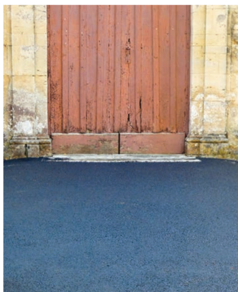
Loucelles Rue de l'Église (parvis de l'église)