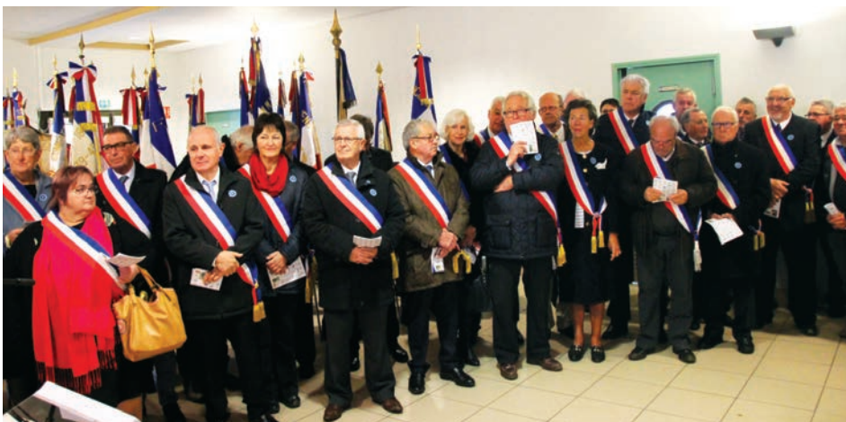
Les maires des communes