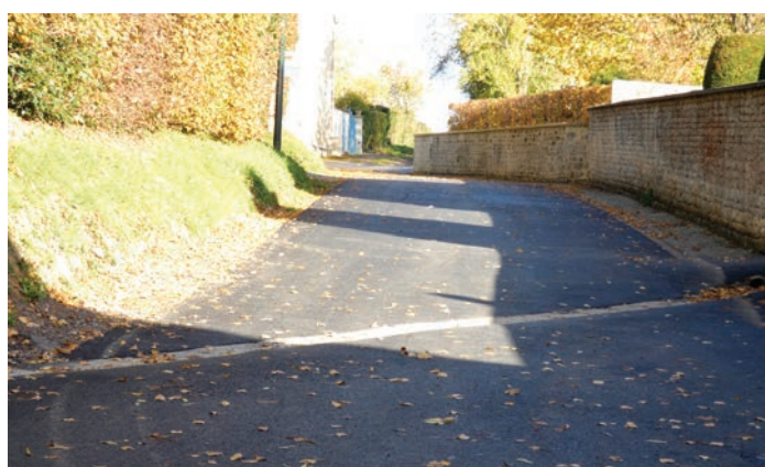
Loucelles - Rue de l'Église

Un marché avait été lancé et ce sont les entreprises Martragny TP et Mastello to qui ont réalisé les travaux. Après que la chaussée ait « séché » et « déshuilé », les marquages au sol ont été repeints. À l'occasion de ces travaux et si nécessaire, les communes ont réalisé des changements de bordures et revêtu les trottoirs. Certaines communes comme Loucelles ont effectué des travaux d'accessibilité à leurs bâtiments.