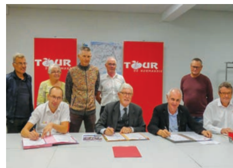
Signature de la convention avec le Tour de Normandie

partenariat. Les coureurs s'élanceront de Tilly-sur-Seulles en direction du sud vers Juvigny-sur-Seulles et Saint-Vaast-sur-Seulles. Le dimanche 31 mars, à nouveau le Tour de Normandie parcourra l'intercom en passant notamment par Asnelles, Meuvaines, Ver-sur-Mer, Graye-sur-Mer, Amblie (Pont-sur-Seulles), Creully-sur-Seulles, Moulins-en-Bessin, Loucelles, Audrieu et Fontenay-Le-Pesnel.